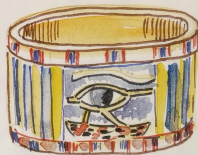
БРАСЛЕТ С ГЛАЗОМ УАДЖЕТОМ